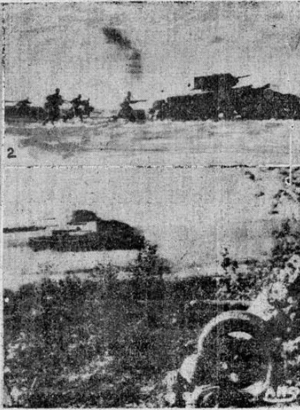
(1) Visión de la lucha contra los nazis invasores. El grabado nos muestra a soldados soviéticos en lucha cuerpo a cuerpo, viéndose a uno de ellos en momentos de arrojar una granada de mano. Los restantes se disponen a encarar al enemigo con sus bayonetas. (2) Los soviéticos desorientan a los germanos con súbitos movimientos inesperados, destruyendo tanquer del "feucher", a los que previamente los tanques soviéticos han alcanzado con sus proyectiles. De inmediato, los aparatos germanicos son rodeados por la infantería rusa que hace prisioneros a los tanquistas nazis. (3) Escena tomada en una granja de Rusia cerca al frente de guerra, en momentos de cargarse allí de proyectiles y armas para ser conducidos a la línea de fuego para contener al invasor fascista. (4) Tanque pesado del ejército soviético en momentos de salir de su escondite para atacar a tanques de Hitler. Las unidades rusas sorprenden a los nazis, apoyados en su acción por artillería anti-tanque que permanecía igualmente oculta.