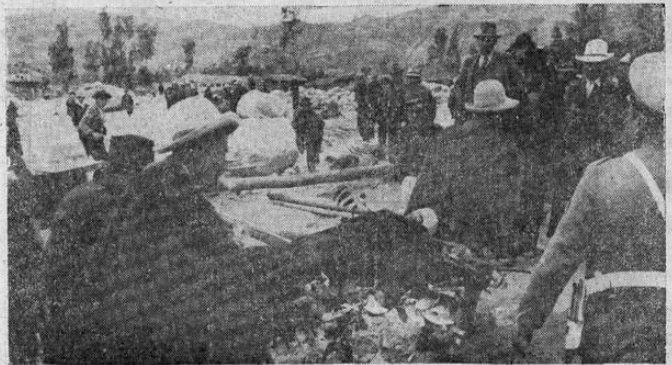
Una inundación destruyó en Huaraz, en el Perú, toda la sección residencial de la población, muriendo cerca de 500 personas. La foto muestra una escena de la labor de rescate

FUERZAS INGLESAS Y CIPAYOS INDIOS REFUERZAN A LOS AUSTRALIANOS EN SINGAPUR