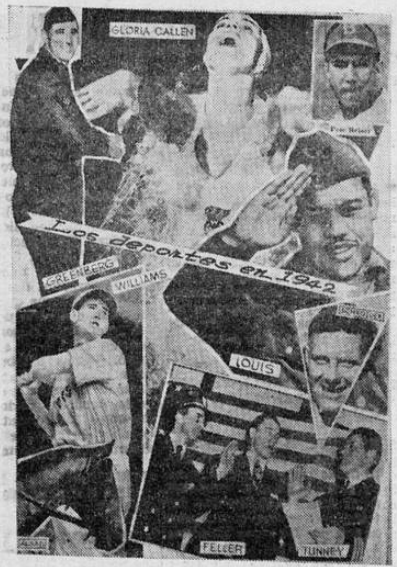
Algunas de las figuras deportivas destinadas a brillar en 1942.

enemigo que ahora posee aeródromos tan próximos a Singapur que puede enviar enjambrados de aparatos de caza para proteger a sus bombarderos. Pero esa actividad aérea si bien es molesta tiene escasa importancia si se la compara con los arrolladores ataques lanzados por la fuerza de tierra que han avanzado a través de las selvas hasta hallarse a sólo unos 110 kilómetros de la isla de Singapur. E laspecto más grave de la situación es que ahora han llegado a un terreno relativamente llano en el que se hallan las plantaciones y en el que su superioridad en fuerzas mecanizadas puede ser aprovechada en forma máxima.